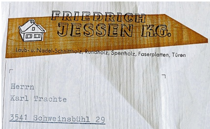
Der Briefkopf der Dortmunder Firma Jessen, die das Sägewerk in Schwalefeld betrieb.