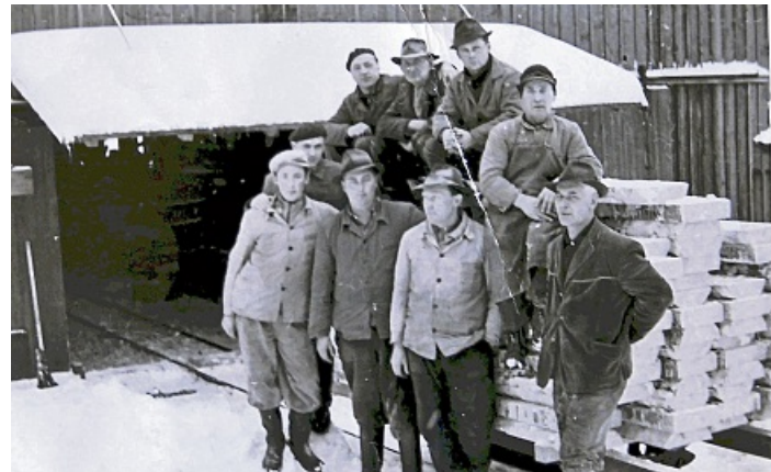
Die Belegschaft des Schwalefelder Sägewerks im Winter vor zugeschnittenen Brettern.