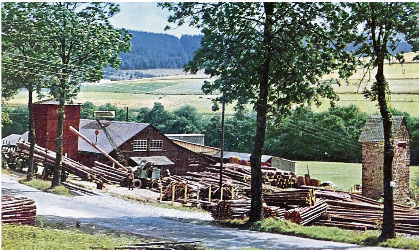
Blick auf das Sägewerk Jessen am Rande Schwalefelds. Vorn wird gerade angeliefertes Stammholz entladen. Rechts steht eine Transformatorenstation. Von dort aus wurde das Werk mit Strom versorgt.