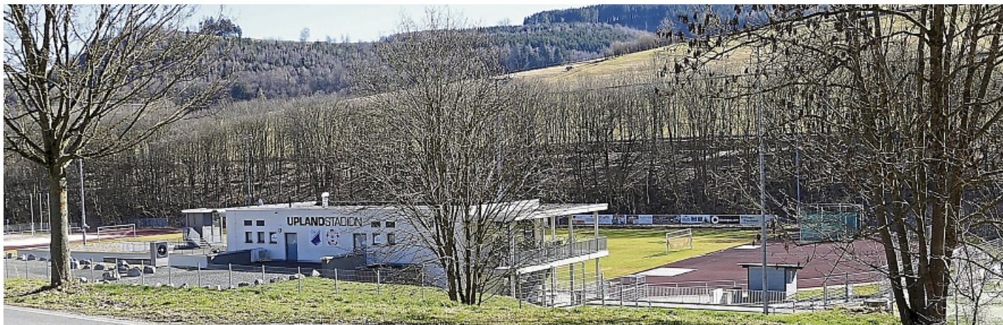
Das Gelände des ehemaligen Schwalefelder Sägewerks heute. An gleicher Stelle steht seit 2018 das Uplandstadion.

das anfallende Abfallholz, das mit einer elektrischen Ladehilfe auf Loren gehoben und draußen auf dem großen Lagerplatz gestapelt wurde.